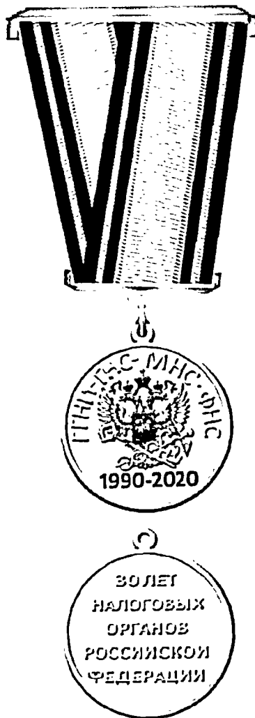
РИСУНОК памятной медали Федеральной налоговой службы «30 лет налоговых органов Российской Федерации»

Приложение № 2 к Положению о памятной медали Федеральной налоговой службы «30 лет налоговых органов Российской Федерации», утвержденному приказом ФНС России от «10» 02 2020 г. № ЕФ-44/86@